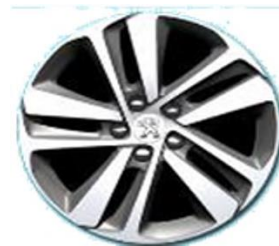
Алуминиева джанта 17"