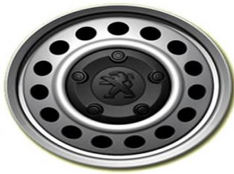
Стоманена джанта с черни болтове 17"