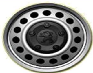
Стоманена джанта с черни болтове 16"