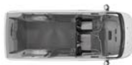
FURGÓN 6.1 m 3 1,400 kg