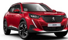
ELEXIR RED (sérlitur)