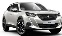
PEARL WHITE (sérlitur)