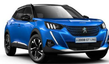
BLUE VERTIGO (sérlitur)