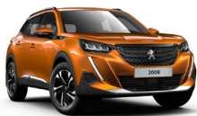
ORANGE FUSION (málmilitur án aukakostnaðar)