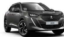
PLATINIUM GREY (málmilitur)