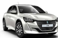
BLANC NACRÉ (Sérlitur)

Í Vefsýningarsal er að finna alla lausa bíla á lager og í pöntun. Þegar þú finnur draumabílinn, sendir þú fyrirspurn og söluráðgjafi svarar um hæð.