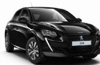
NOIR PERLA NERA (Málmilitur)