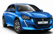
BLEU VERTIGO (Sérlitur)