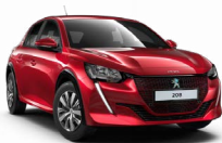
ROUGE ELIXIR (Sérlitur)