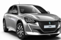
GRIS ARTENSE (Málmilitur)