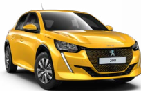
JAUNE FARO (Málmilitur án aukakostnaðar)